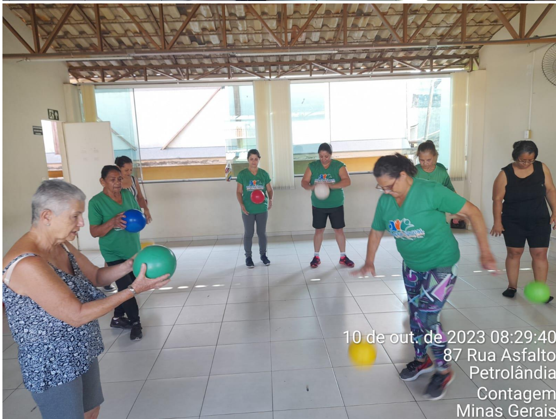
10 de out. de 2023 08:29:40 87 Rua Asfalto Petrolândia Contagem Minas Gerais