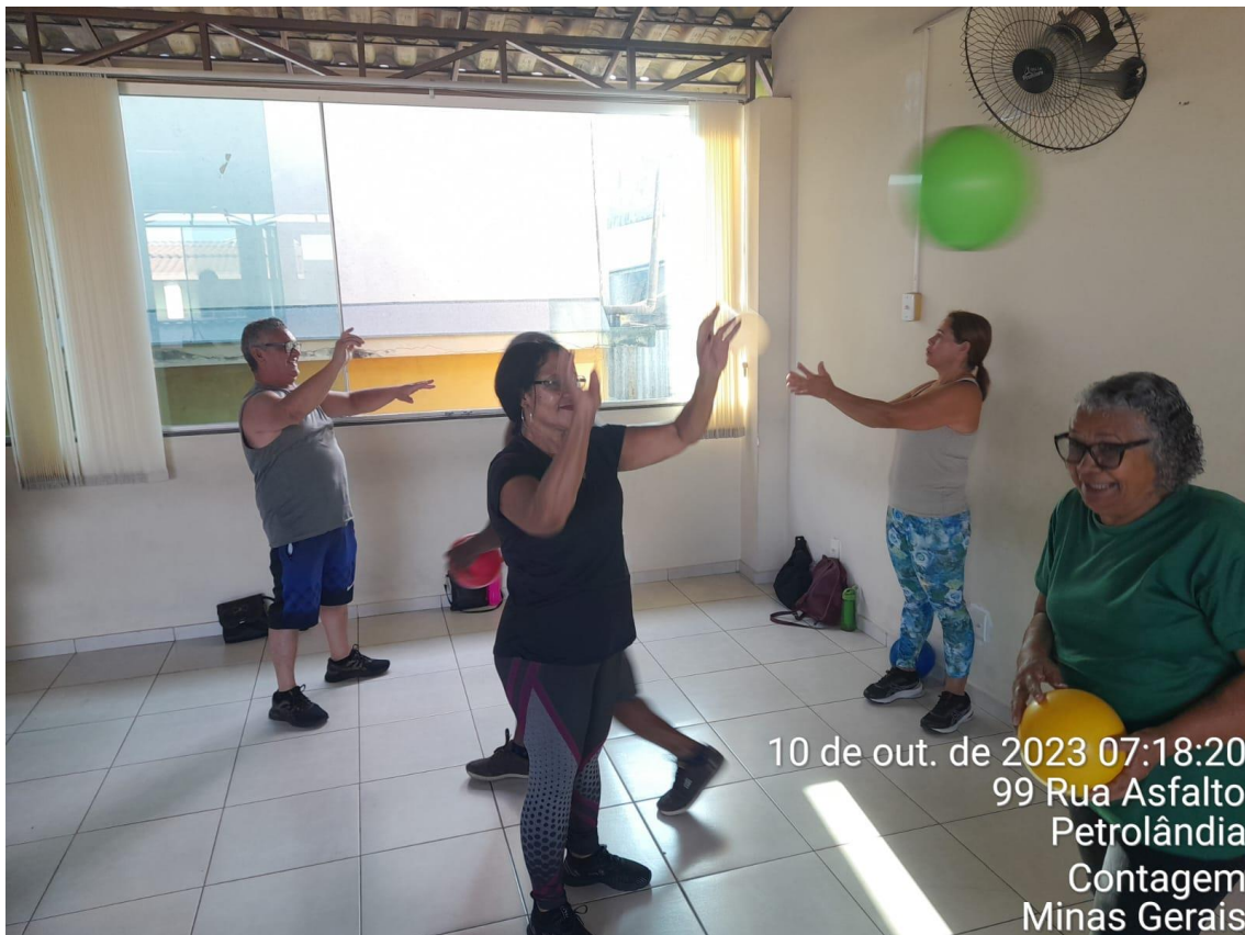
10 de out. de 2023 07:18:20 99 Rua Asfalto Petrolândia Contagem Minas Gerais