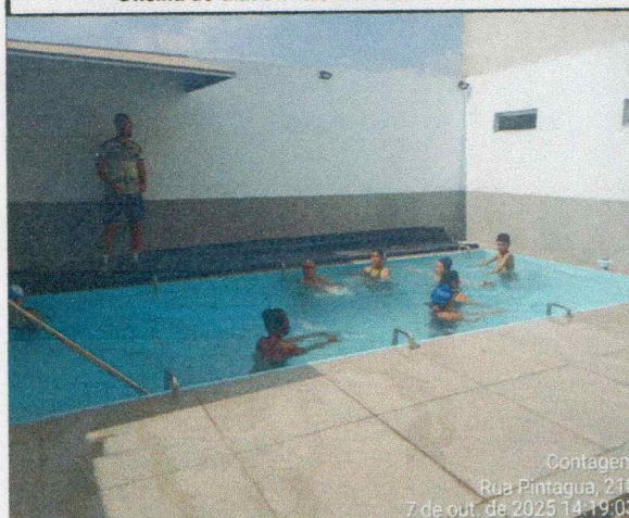
Oficina do dia: 07/10/2025 07:00 às 08:00 Hs