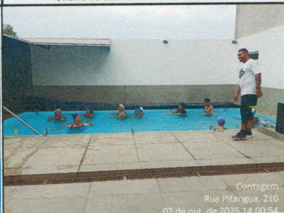
Oficina do dia: 02/10/25 - 14:00 às 15:00 Hs