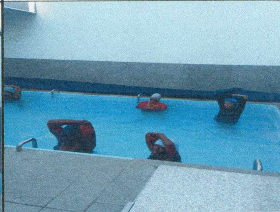
Oficina do dia: 21/10/2025-14:00 às15:00 Hs