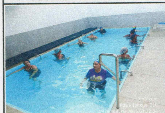
Oficina do dia: 09/10/2025-07:00 às 08:00 Hs