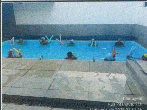
Oficina do dia: 07:00 às 08:00 Hs