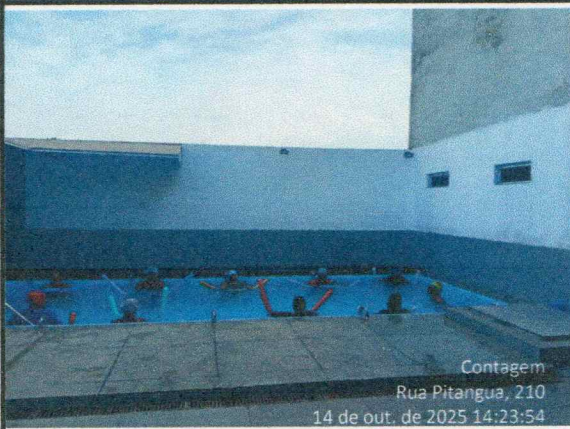
Oficina do dia: 14/10/2025-14:00 às15:00 Hs