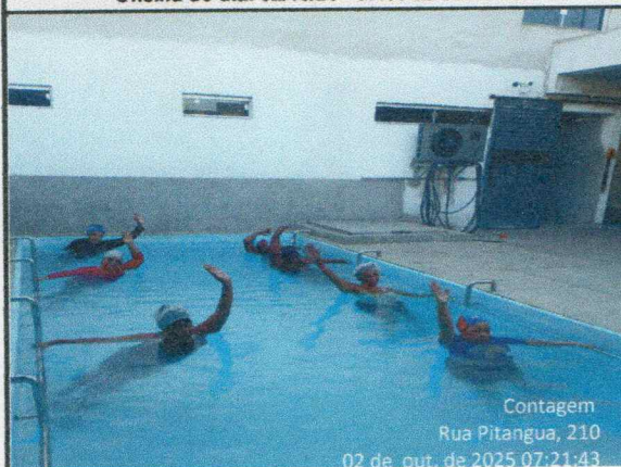
Oficina do dia: 02/10/25 - 07:00 às 08:00 Hs