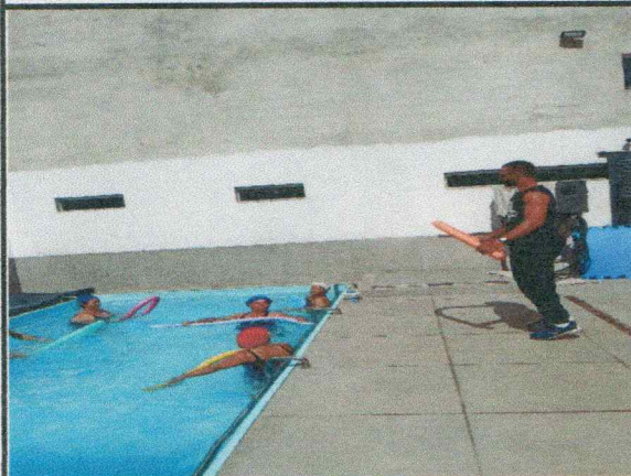
Oficina do dia: 16/10/2025-07:00 às 08:00 Hs