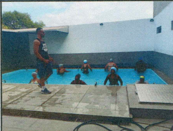
Oficina do dia: 16/10/2025-14:00 às15:00 Hs