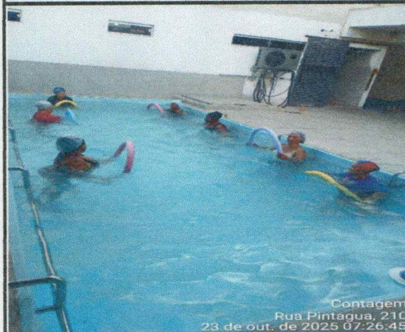
Oficina do dia: 23/10/2025-07:00 às 08:00 Hs