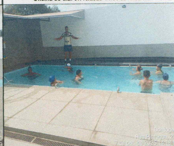
Oficina do dia: 07/10/2025-14:00 às 15:00 Hs