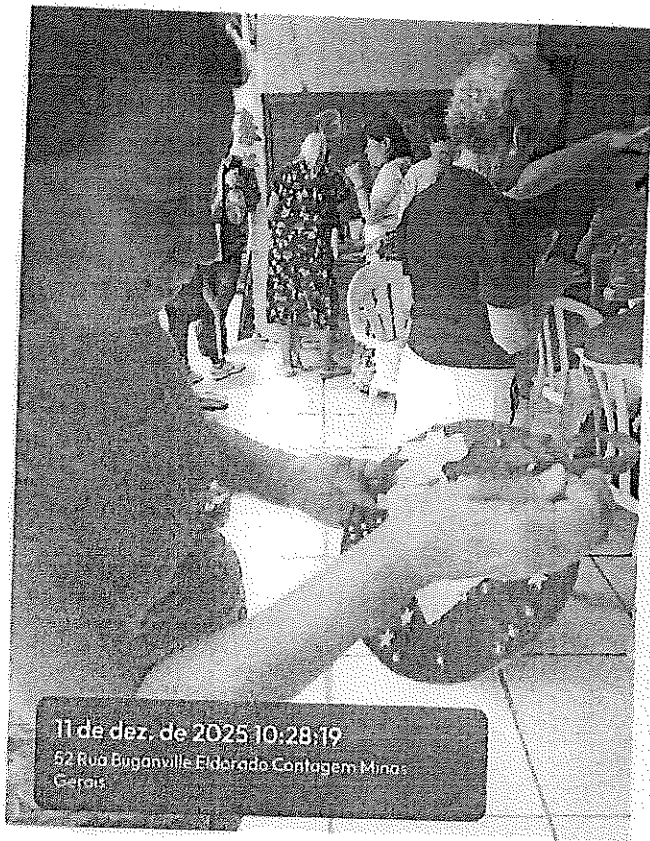
11 de dez. de 2025 10:28:19 52 Rua Buganville Eldorado Contagem Minas Gerais