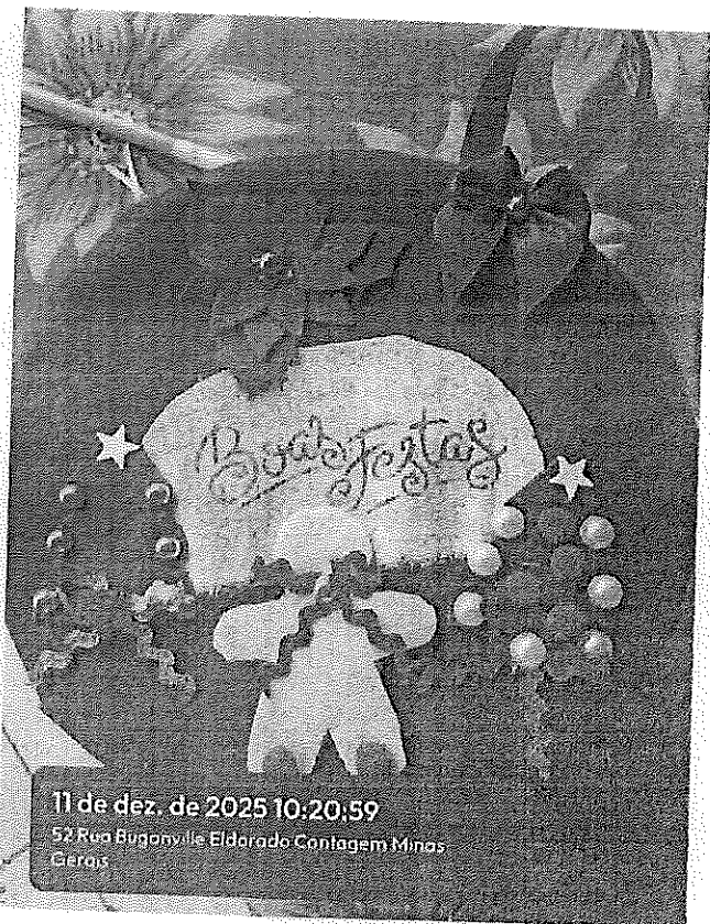
11 de dez. de 2025 10:20:59 52 Rua Buganville Eldorado Contagem Minas Gerais