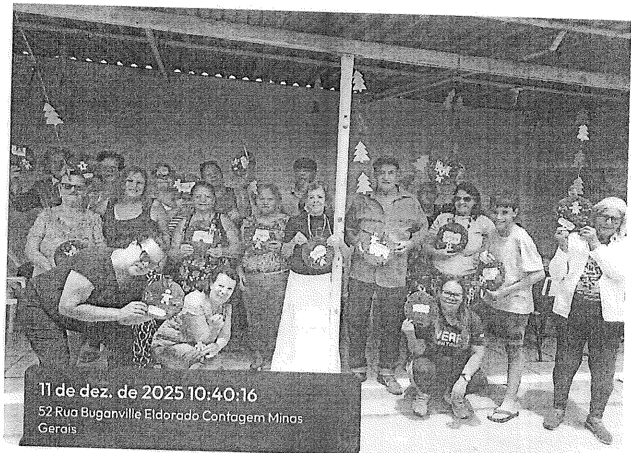
11 de dez. de 2025 10:40:16 52 Rua Buganville Eldorado Contagem Minas Gerais