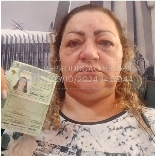
23 out 2024, 14-35-44.jpeg

Foto da face com documento com hash SHA256 prefixo a8b2ca(...)