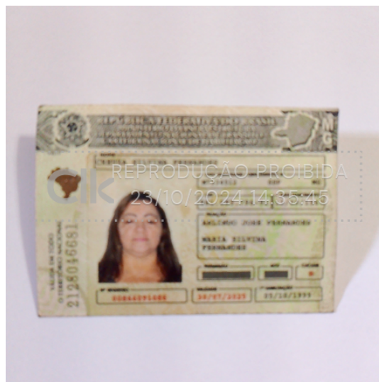
official_document_front_23 out 2024, 14-35-44.png

Foto da frente do documento oficial com hash SHA256 prefixo 89cc9f(...)