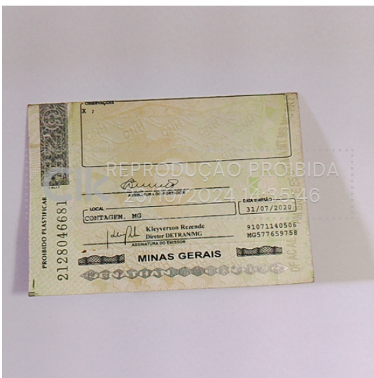
official_document_back_23 out 2024, 14-35-44.png

Foto do verso do documento oficial com hash SHA256 prefixo 9ccf9c(...)