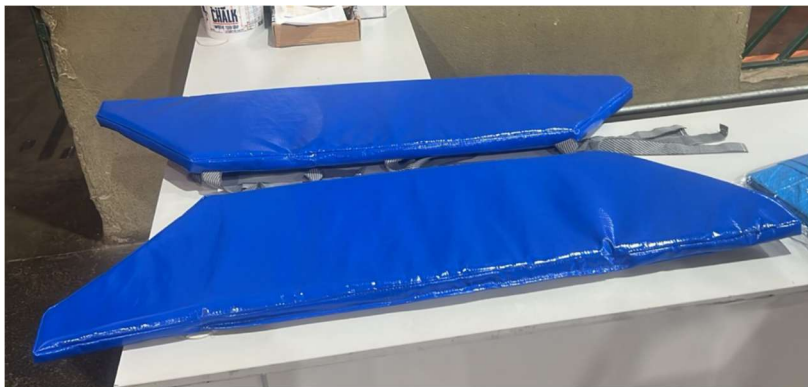
Fotos de protetores de molas