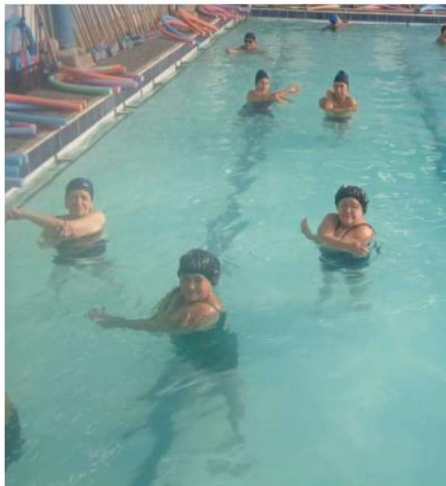
Oficina esportiva - Hidroginástica Núcleo Eldorado – 05/09/2024