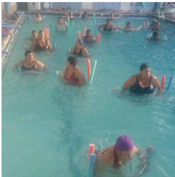
Oficina esportiva - Hidroginástica Núcleo Eldorado – 06/08/2024