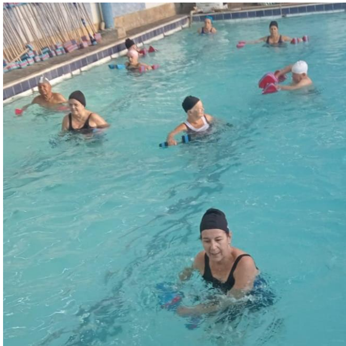
Oficina esportiva - Hidroginástica Núcleo Eldorado – 15/08/2024