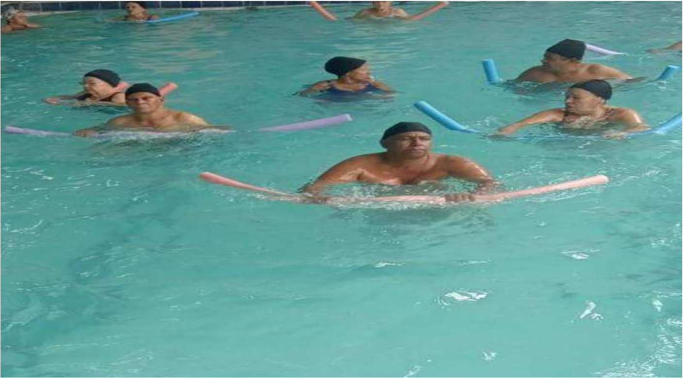
Oficina esportiva - Hidroginástica Núcleo Eldorado - 03/10/2024