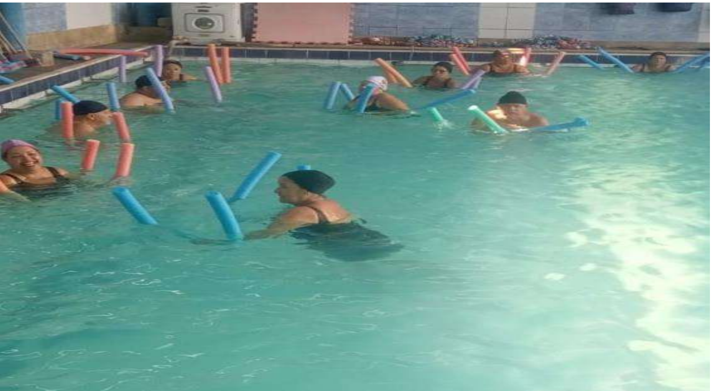
Oficina esportiva - Hidroginástica Núcleo Eldorado - 15/10/2024