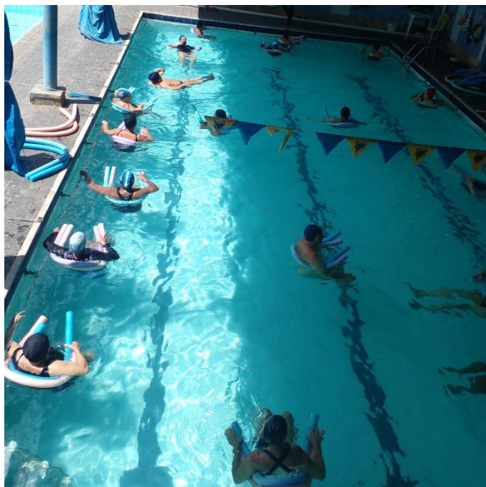
Oficina esportiva - Hidroginástica Núcleo Eldorado – 19/11/2024