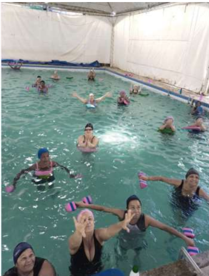
PROJETO JOVEM GUERREIRO HIDROGINÁSTICA 3º IDADE DATAS: 13/06/2024 E 27/06/2024