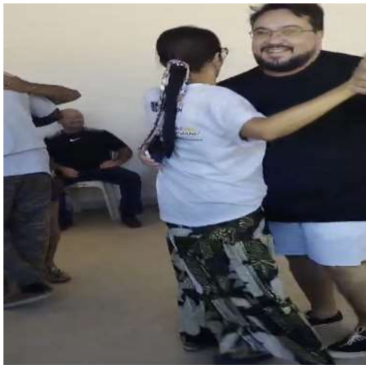
Oficina de Dança. Data: 19/06/2024 Contagem da Maturidade Nacional