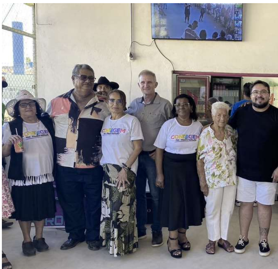
DINAMICA DE GRUPO 12/06/2024 SEDE