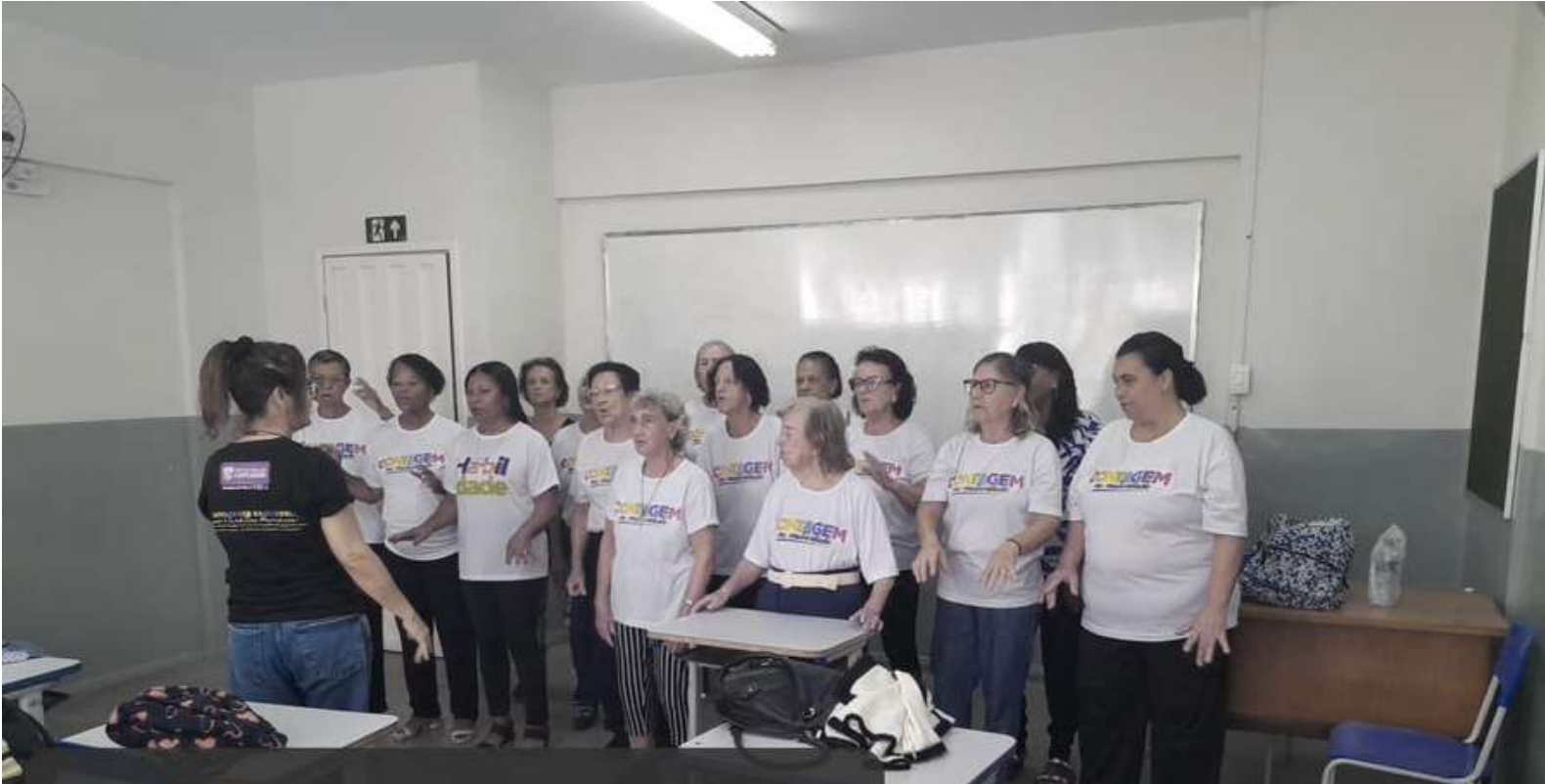
Roda de Conversa Data: 13/06/2024 Contagem da Maturidade - Eldorado