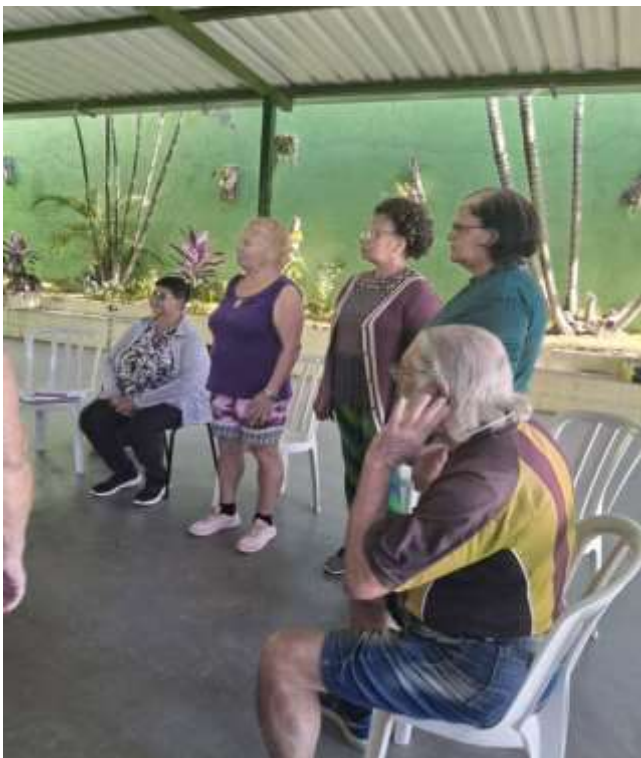
Roda de Conversa Data: 25/06/2024 Contagem da Maturidade