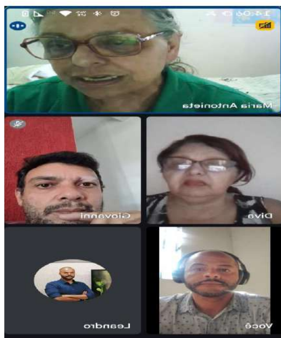
Reunião virtual 19/08