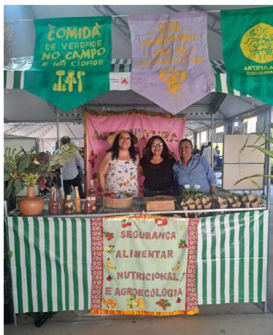
27/08 – 20 anos de Políticas Públicas