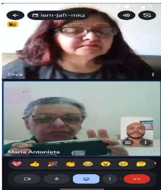
Reunião virtual 06/08