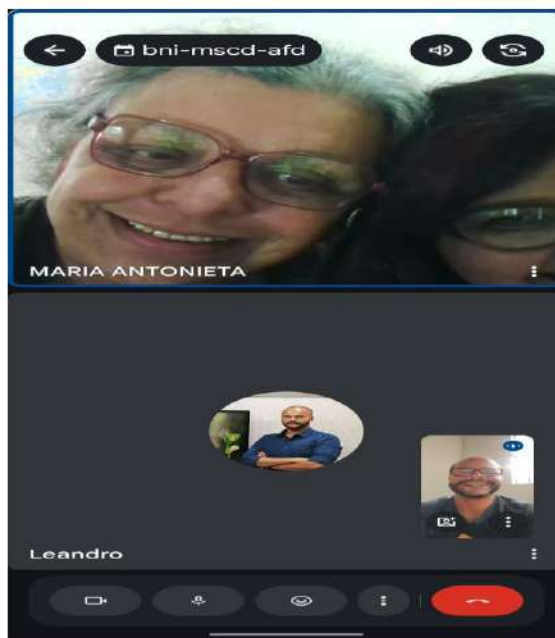
Reunião virtual 12/08