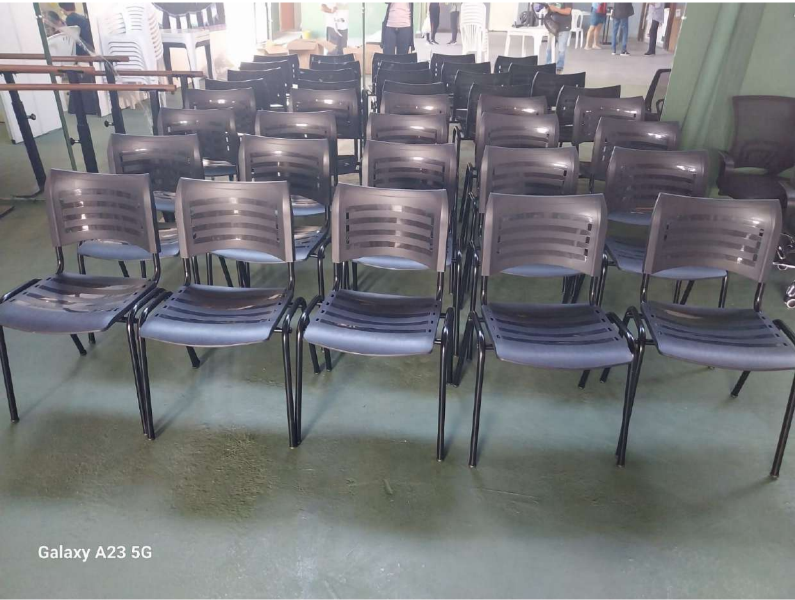
Galaxy A23 5G