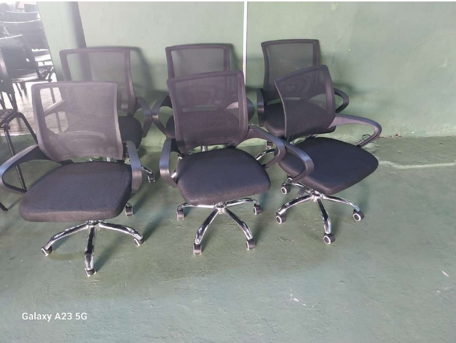
Galaxy A23 5G