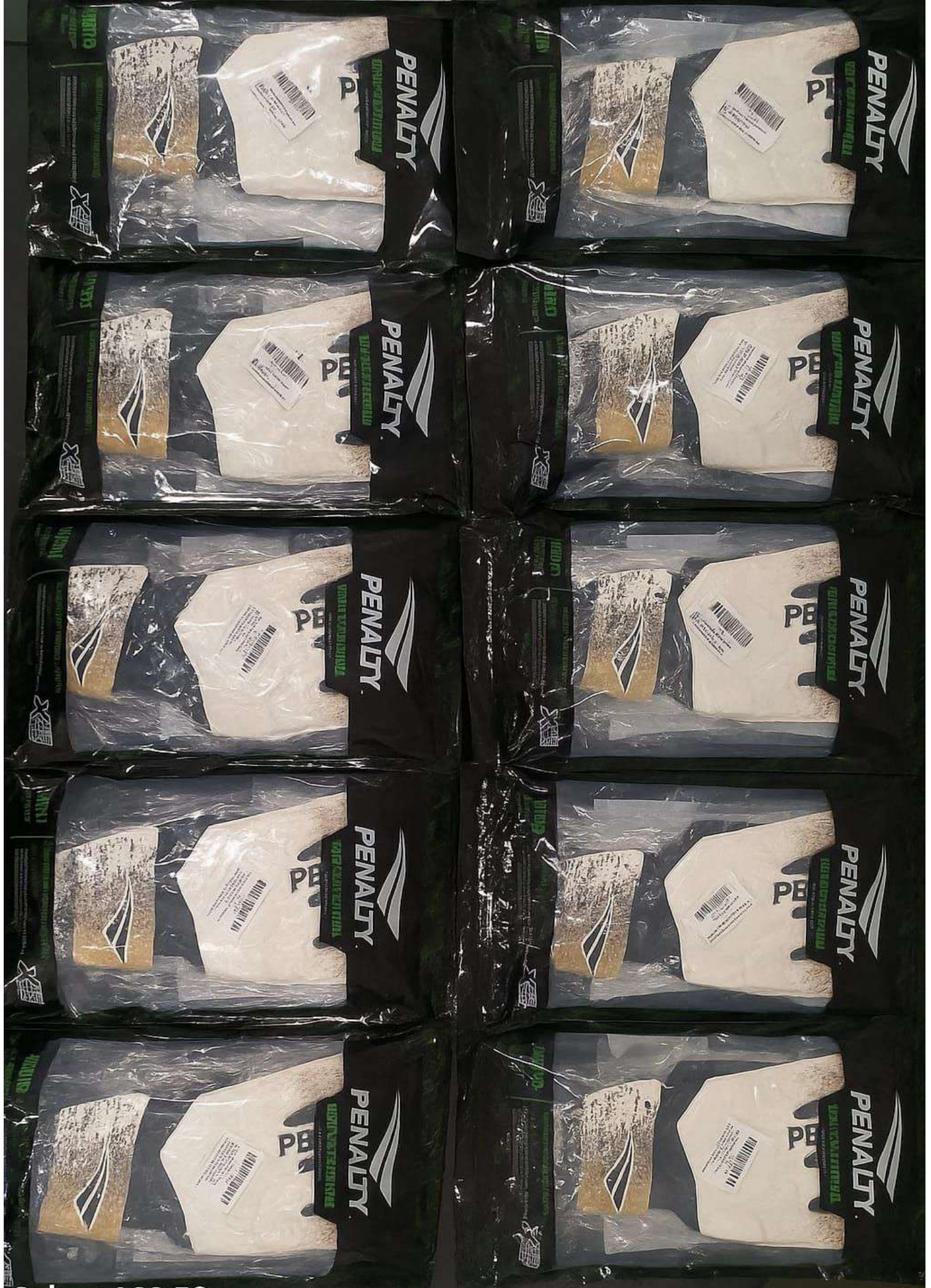
Galaxy A23 5G