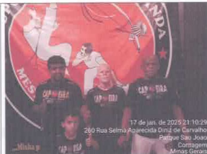
BAIRRO PARQUE SÃO JOÃO