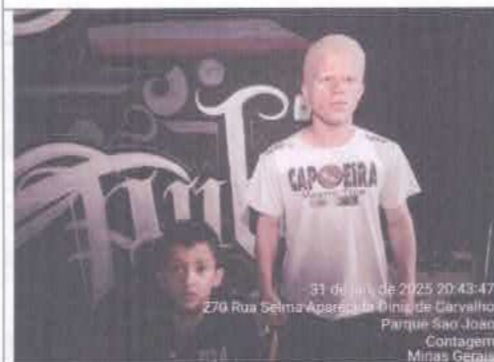
BAIRRO PARQUE SÃO JOÃO