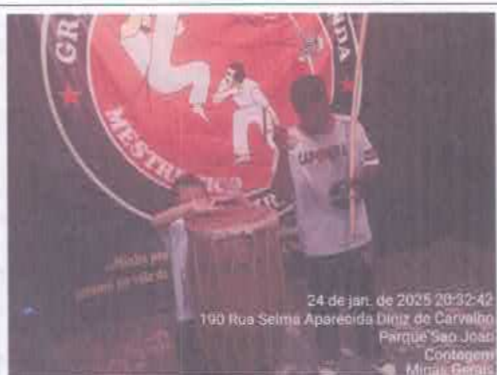
BAIRRO PARQUE SÃO JOÃO