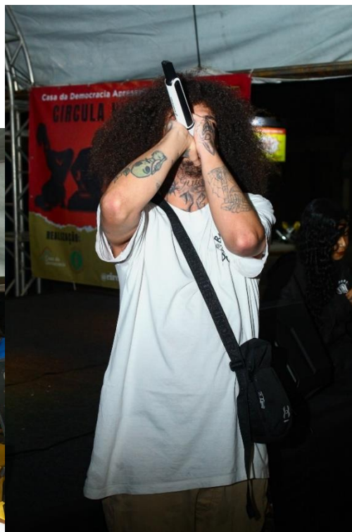
Foto 1 e 2: Circula Hip Hop – Batalha do AB. Av. Teleférico - Conj. Agua Branca, Contagem – MG - CEP 32370-670– 15/08/2025.