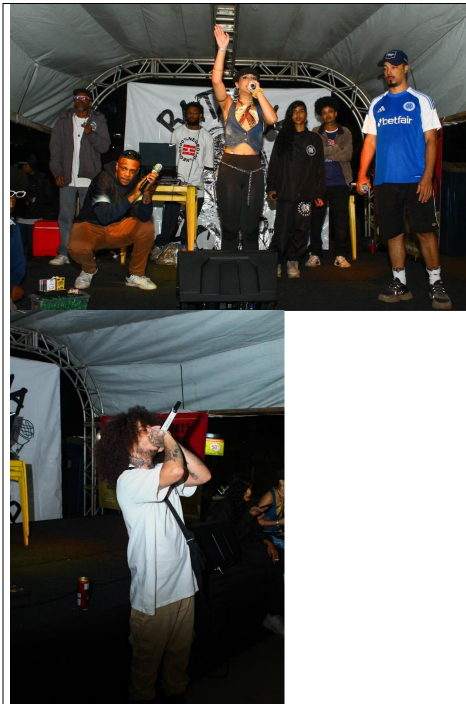
Foto 3 e 4: Circula Hip Hop – Batalha do AB. Av. Teleférico - Conj. Agua Branca, Contagem – MG - CEP 32370-670– 15/08/2025.