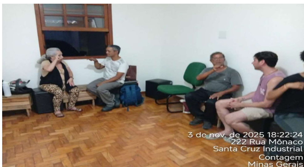
Foto 1 e 2: Curso de LIBRAS. Rua Mônaco, 222, Santa Cruz Industrial, Contagem – MG – CEP: 32141-018 – 03/11/25