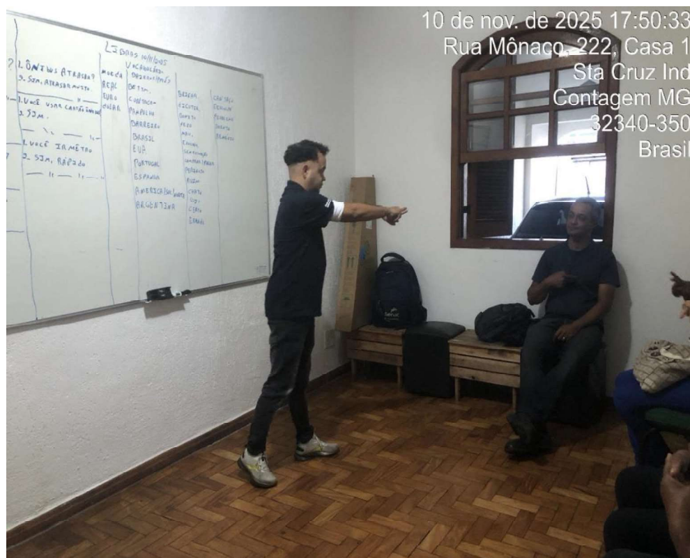
Foto 3 e 4: Curso de LIBRAS. Rua Mônaco, 222, Santa Cruz Industrial, Contagem – MG – CEP: 32141-018 – 10/11/25