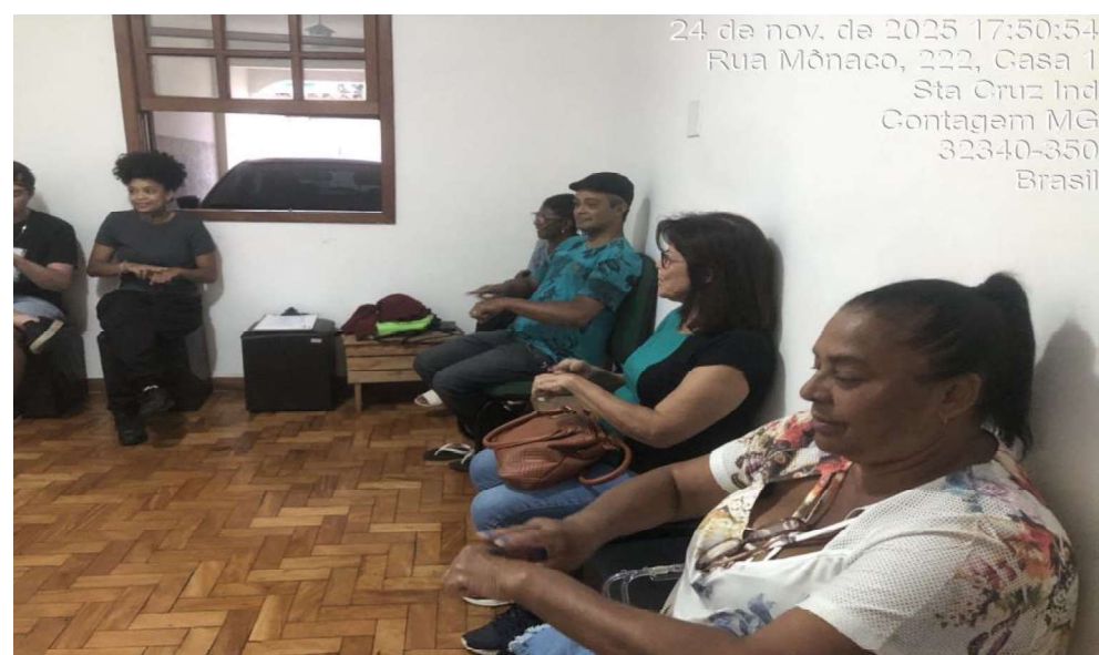
Foto 7 e 8: Curso de LIBRAS. Rua Mônaco, 222, Santa Cruz Industrial, Contagem – MG – CEP: 32141-018 – 24/11/25