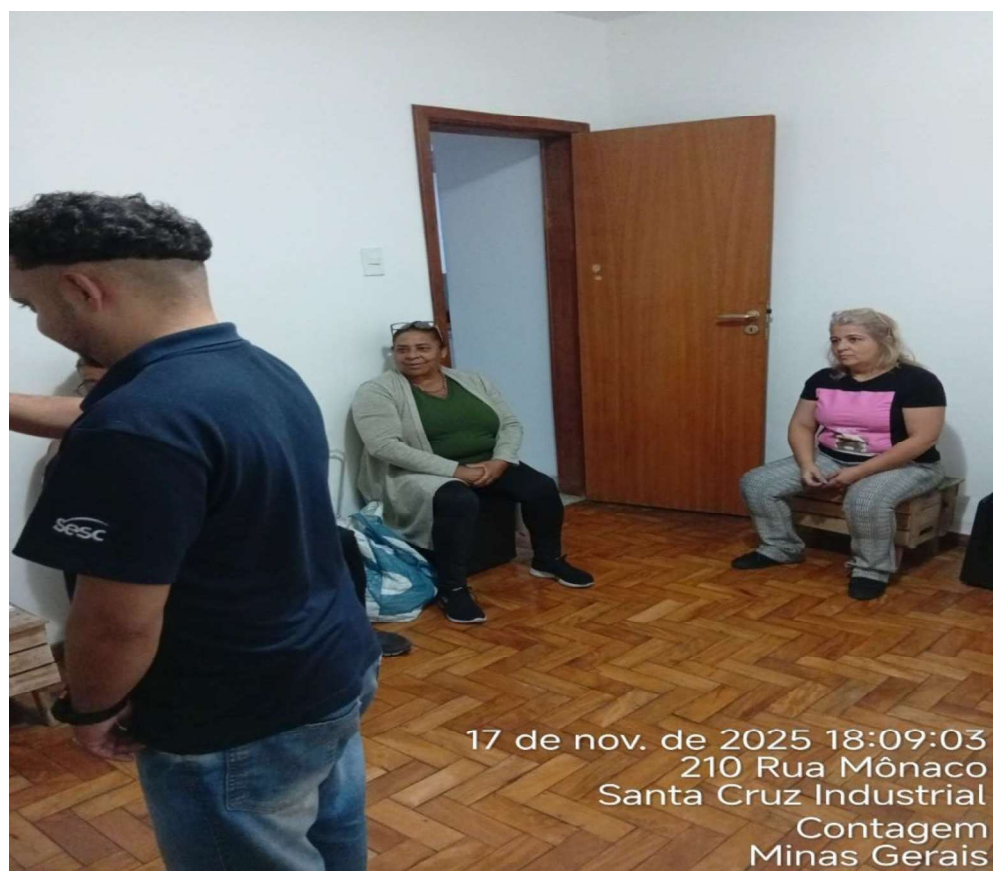
Foto 5 e 6: Curso de LIBRAS. Rua Mônaco, 222, Santa Cruz Industrial, Contagem – MG – CEP: 32141-018 – 17/11/25