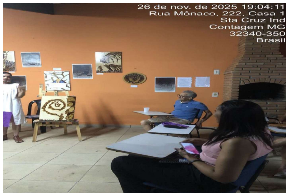
Foto 1 e 2: Roda De Conversa – “A Arte de Mãos Dadas com Vozes, Corpos e a Resistência Feminina” . . Rua Mônaco, 222, Santa Cruz Industrial, Contagem – MG - CEP: 32141-018 – 26/11/2025