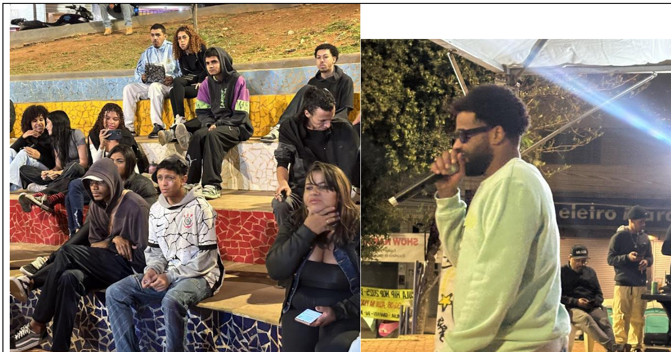
Foto 3 e 4: Circula Hip Hop – Batalha do Safari. R. VC-1, S/N - Estaleiro, Contagem - MG, 32050-060–30/08/2025.