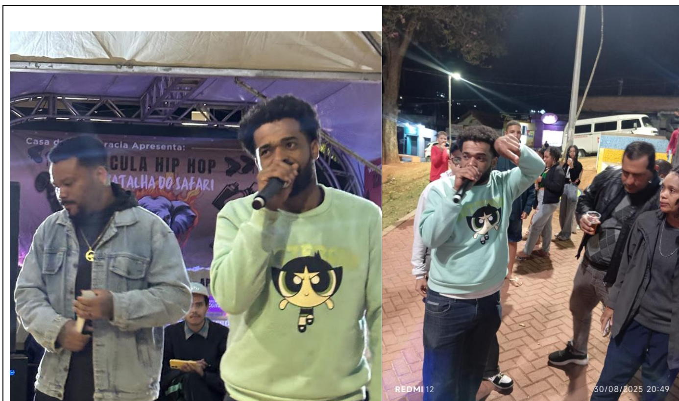
Foto 1 e 2: Circula Hip Hop – Batalha do Safari. R. VC-1, S/N - Estaleiro, Contagem - MG, 32050-060–30/08/2025.