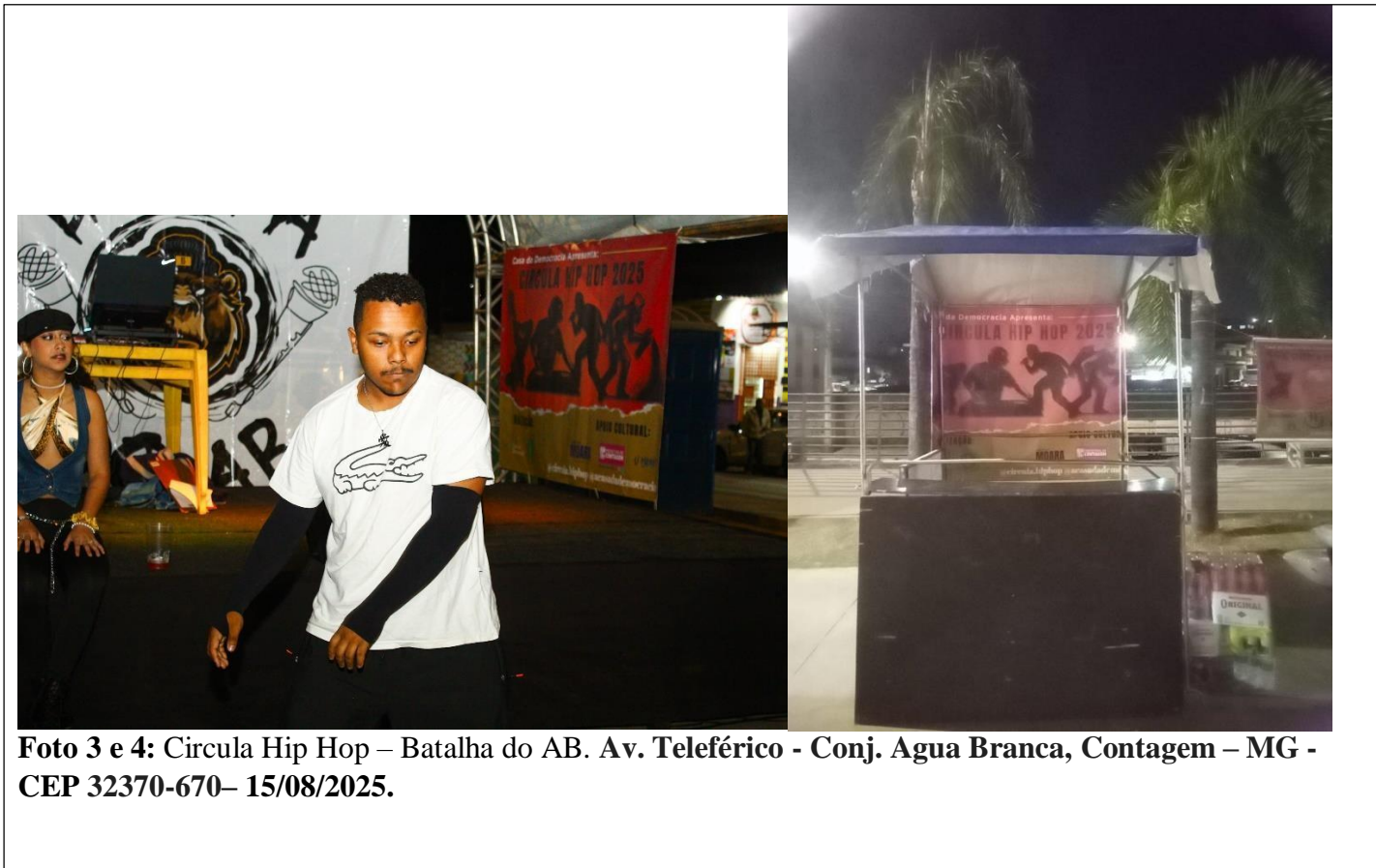
Foto 3 e 4: Circula Hip Hop – Batalha do AB. Av. Teleférico - Conj. Agua Branca, Contagem – MG - CEP 32370-670– 15/08/2025.