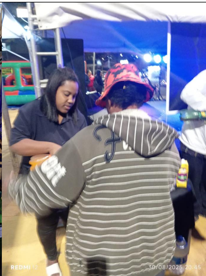
Foto 3 e 4: Circula Hip Hop – Batalha do Safari. R. VC-1, S/N - Estaleiro, Contagem - MG, 32050-060–30/08/2025.