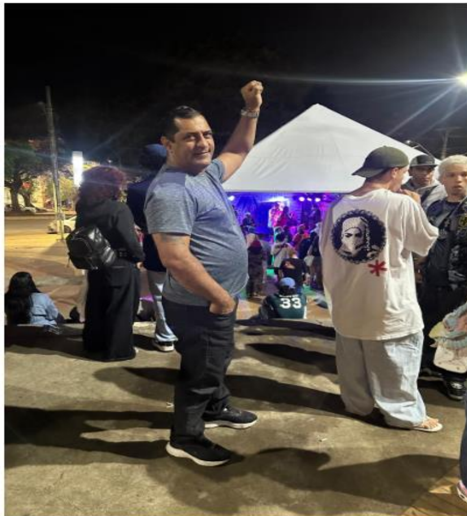
Foto 1 2 e 3: Circula Hip Hop – Batalha do Jabu. Praça Tiradentes - Centro – Contagem – MG, 32041-770 Contagem – MG – em – 11/10/2025.